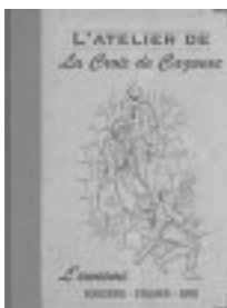
L'Atelier de La Croix de Cazenac